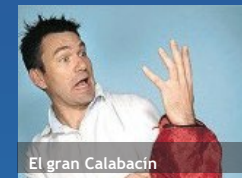
El gran Calabacín