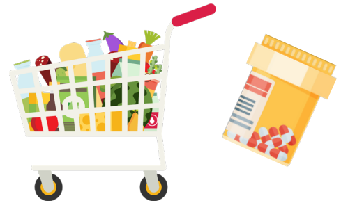
생필품 구매 및 필수 업무를 위해 외출할 때

천 마스크를 착용하면 당신의 세균이 다른 사람에게 퍼지는 것을 방지할 수 있습니다.