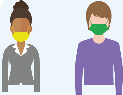
주변에 다른 사람들이 함께 있을 때