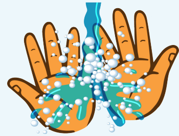
손을 자주 씻되, 비누와 따뜻한 물로 20초 이상 씻기