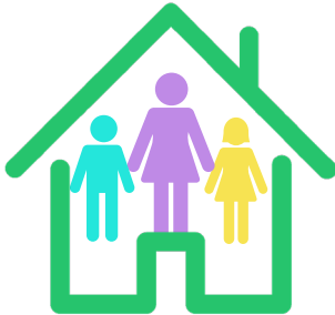
자택 안에 머물기