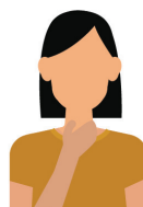
sore throat dolor de garganta