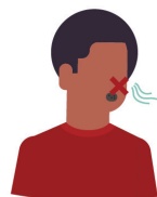
Runny nose, congestion or recent loss of smell or taste congestión nasal, pérdida reciente del olfato o del gusto