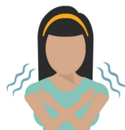
fever or chills fiebre o escalofríos