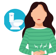
Nausea, vomiting or diarrhea Náuseas, vómitos o diarrea