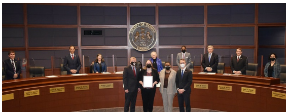
Mayo como Mes de Apreciación al Maestro