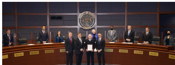
9 al 15 de mayo como Semana Nacional del Ejército de Salvación