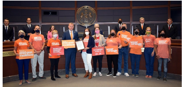
3 de junio como Día de Concientización sobre la Violencia Armada