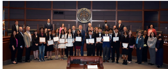
Estudiantes ganadores del desafío tecnológico Shark Tank 2021-22