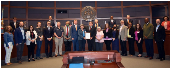
Mayo como mes de los estadounidenses mayores