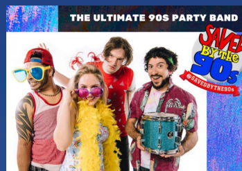
THE ULTIMATE 90S PARTY BAND