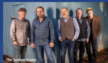
The Seldom Scene