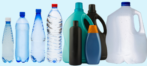
CHAI LỌ VÀ THÙNG NHỰA (VỚI NẮP ĐẬY)