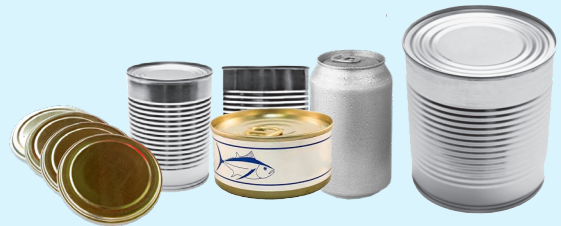
HỘP THỰC PHẨM BẰNG KIM LOẠI VÀ LỌN NƯỚC GIẢI KHÁT