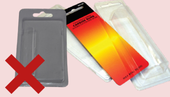
BAO BÌ TỔNG HỢP