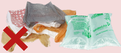
TÚI NHỰA, MÀNG BỌC VÀ BAO BÌ ĐÓNG GÓI