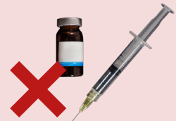
KIM TIÊM VÀ RÁC THẢI Y TẾ