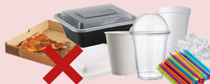
CHÉN CỐC VÀ CÁC LOẠI HỘP CHỨA BẰNG MÚT XỐP VÀ NHỰA