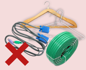
MÓC TREO, ỒNG CAO SU VÀ DÂY CÁP