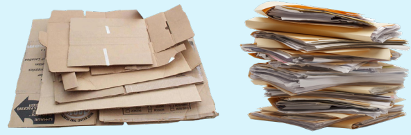
GIẤY VÀ HỘP CÁC TÔNG TÔNG HỘP

*Đối với các đồ đặc biệt như hộp thực phẩm dạng bình đựng, kiểu vỏ sò và các loại nhựa khác, xin vui lòng liên hệ với người vận chuyển.