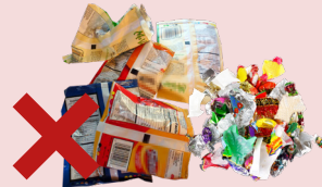
TÚI THỰC PHẨM VÀ VỎ BỌC