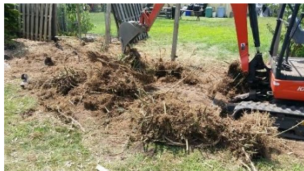
در حین کندن