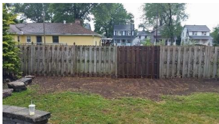
پس از کندن