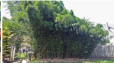
قبل از کندن

توجه: مهار مؤثر بامبوی رونده ممکن است به ترکیبی از روش‌های فوق‌الذکر نیاز داشته باشد.