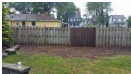
پس از کندن