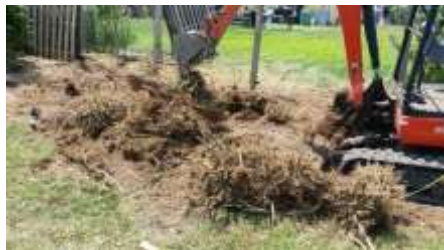
در حین کندن