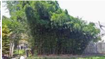
قبل از کندن

توجه: مهار مؤثر بامبوی رونده ممکن است به ترکیبی از روش‌های فوق‌الذکر نیاز داشته باشد.