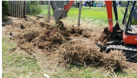
Durante la eliminación