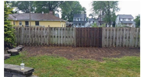
Después de la eliminación

Nota: La contención eficaz del bambú invasor puede requerir una combinación de las opciones mencionadas anteriormente.