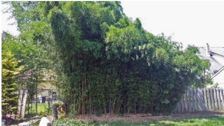
Antes de la eliminación