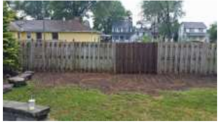
ہٹانے کے بعد