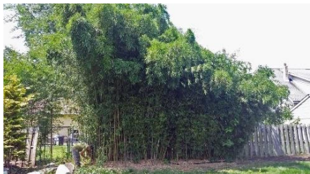
Trước khi loại bỏ