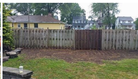
Sau khi loại bỏ

Lưu ý: Để kiểm soát hiệu quả tre thân rễ chạy phát triển, có thể bạn phải kết hợp các phương án được liệt kê ở trên.