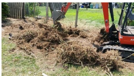
Trong khi loại bỏ