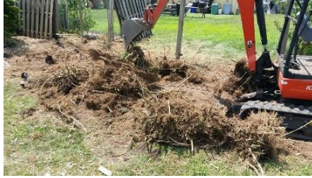
ہٹانے کے دوران