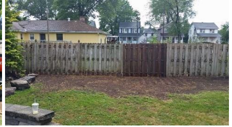
ہٹانے سے پہلے

نوٹ: بانس کو مؤثر طریقے سے قابو میں کرنے کے لیے اوپر دیے گئے اختیارات کے امتزاج کی ضرورت پڑ سکتی ہے۔