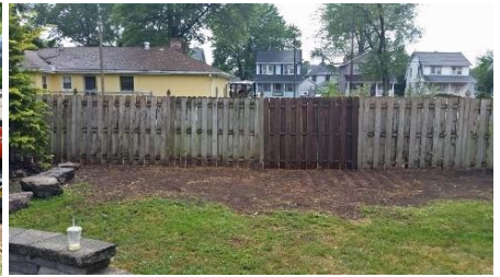
Sau khi loại bỏ

Lưu ý: Để kiểm soát hiệu quả tre thân rễ chạy phát triển, có thể bạn phải kết hợp các phương án được liệt kê ở trên.