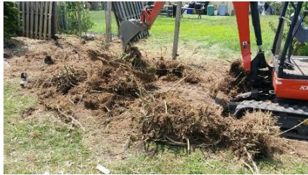
Trong khi loại bỏ