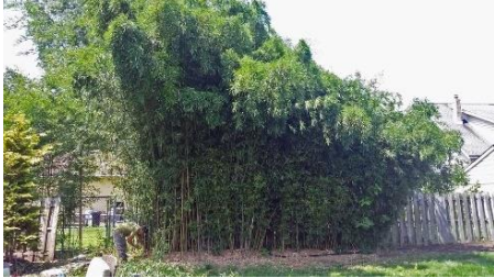
Trước khi loại bỏ