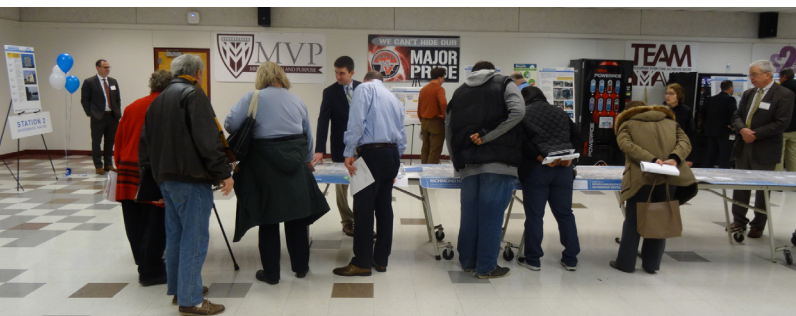
La segunda reunión comunitaria (23 de enero de 2019)

Suscríbete a Fairfax Alerts para estar al día de los detalles de futuras reuniones! Puede revisar presentaciones y otra información del proyecto, visitando la página "Materiales de reunión" en el sitio web del proyecto